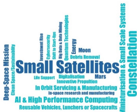
شکل (۲): ابر کدها

در این پژوهش همانطور که پیشتر اشاره شد، ۲۱ سند از ۱۳ کشور به منظور استنتاج روندها و موضوعات محوری صنعت فضایی بررسی شد. با تحلیل متن کامل اسناد که بالغ بر ۱۲۰۰ صفحه بوده است، تعداد ۲۲۹ کد به تفکیک هر واحد تحلیل استخراج شد و به عنوان مجموعه داده ورودی در تحلیل مضمون مورد استفاده قرار گرفتند. ابرکدها در شکل ۲ نشان داده شده است. ابرکدها بر اساس فراوانی آن‌ها در متون مورد بررسی ایجاد و کلمات پرتکرار به اندازه‌ی بزرگی در این نمودارها نمایش داده می‌شوند. همان طور که مشخص است، ماهواره‌های کوچک،